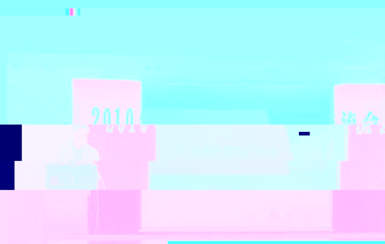
图3 教育学院2010年度学术交流会会场

会议现场气氛热烈，来自北京2010年度教育技术系、各院系、各学院的专家学者齐聚一堂，共同探讨教育技术领域的最新研究成果。